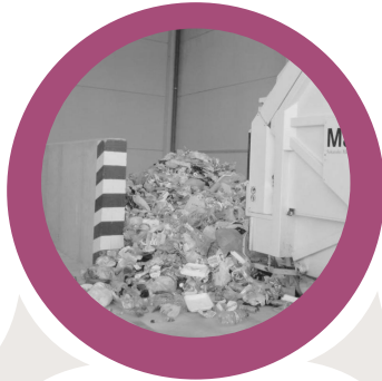
Transferentzia gunea Centro de transferencia