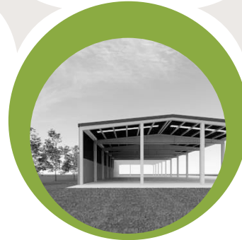
Konpost planta Planta de compostaje