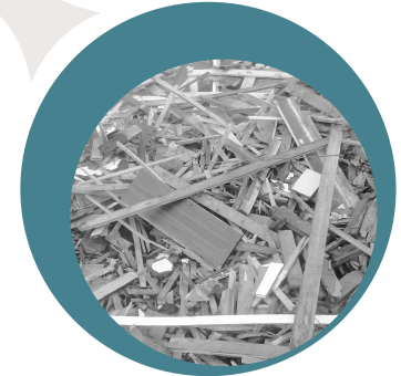
Industrialen biltegia Almacén de industriales