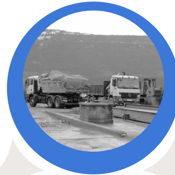
Industrialen zabortegia Vertedero de industriales