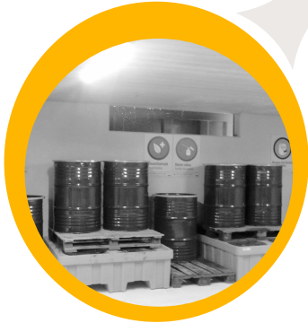
Garbigunea Punto limpio